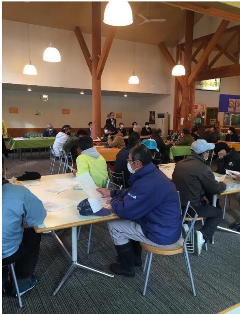
冬期シーズン前、従業員によるミーティング及び索道教育・救助訓練