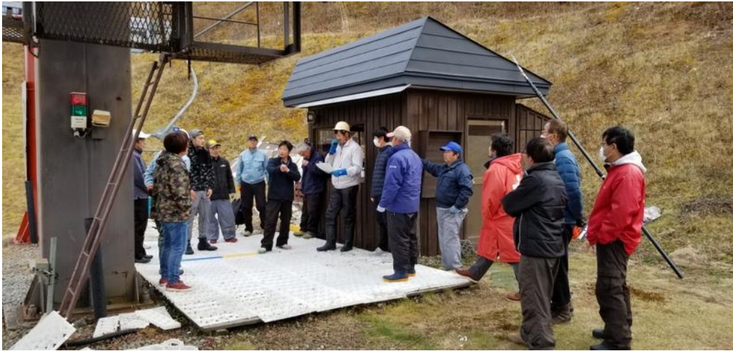
冬期シーズン前、従業員による救助訓練